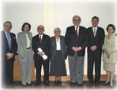
Από αριστερά: Ιωάννης Ταϊφάκος, Φωτεινή Παπαδοπούλου, Βάσος και Ζακλίν Καραγιώργη, Πεύκιος Γεωργιάδης, Σταύρος Ζένιος, Ε. Ηγουμενίδου.

Την Τρίτη, 27 Απριλίου 2004, στην Ερευνητική Μονάδα Αρχαιολογίας, η Φιλοσοφική Σχολή υποδέχθηκε επίσημα τον Δρα Βάσο Καραγιώργη ως Ομότιμο Καθηγητή της Αρχαιολογίας. Ο Καθηγητής Βάσος Καραγιώργης, ο οποίος έχει συνδέσει διεθνώς το όνομά του με την Κυπριακή Αρχαιολογία προσφέροντας μεγάλη υπηρεσία στον τόπο και την Επιστήμη, διετέλεσε πρώτος Καθηγητής της Αρχαιολογίας του Πανεπιστημίου Κύπρου.