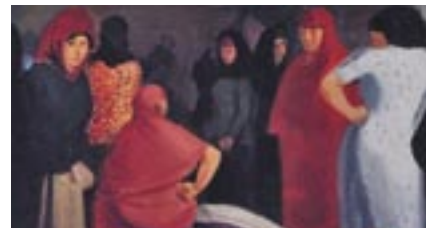
«Γυναίκοπάζαρο», 1949. Πίνακας του Τηλέμαχου Κίνθου που απεικονίζει την ειρηνική συνύπαρξη Ελληνοκυπρίων και Τουρκοκυπρίων από την πρόσκληση της εκδήλωσης.